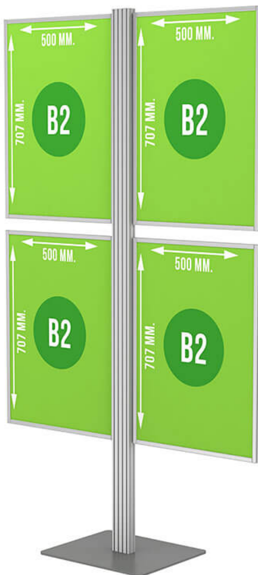
Stojak na plakaty dla Twojej firmy

Proponowany powyżej stojak na plakaty B2 cechuje się przede wszystkim eleganckim, ekskluzywnym wyglądem. Złożony zajmuje znacznie mniej miejsca, co może mieć kluczowe znaczenie w kwestii przenoszenia. Składany prezentier przygotowano tak, aby sam w sobie nie przykuwał wzroku. Natomiast doskonale eksponuje zawieszane na nim plakaty. Samo umieszczenie posterów wewnątrz stojaka jest proste – można to szybko zrobić nawet w zatłoczonym miejscu. Zachęcamy do zapoznania się ze szczegółową specyfikacją.