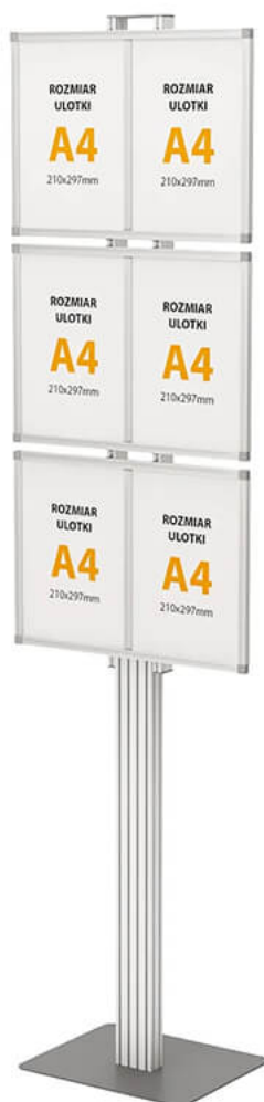
Składany stojak na 6 plakatów A4

Wyjazd na targi branżowe oraz wydarzenia o charakterze prezentacyjnym zawsze wiąże się z wieloma trudnościami organizacyjnymi. Nie dość, że trzeba zaplanować wszystkie dojazdy, posprządać transport i przygotować określone gadżety i prezentacje dla ewentualnych kontrahentów, to jeszcze musimy zająć się przewozem systemów wystawienniczych. Na szczęście istnieją takie rozwiązania jak składany stojak na plakaty , który nie sprawi żadnych problemów podczas pakowania się do wyjazdu.